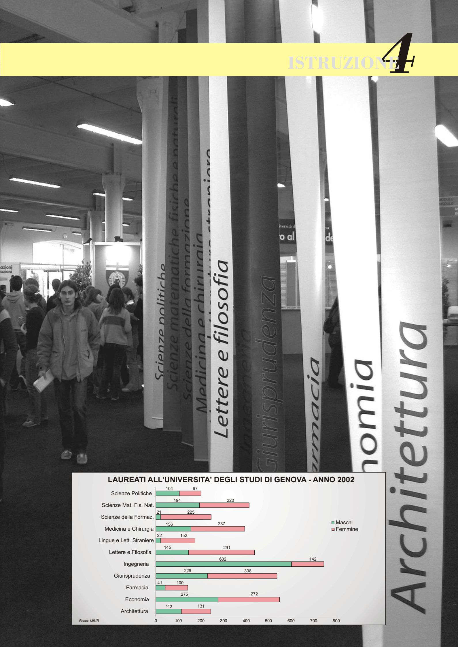
LAUREATI ALL'UNIVERSITA' DEGLI STUDI DI GENOVA - ANNO 2002