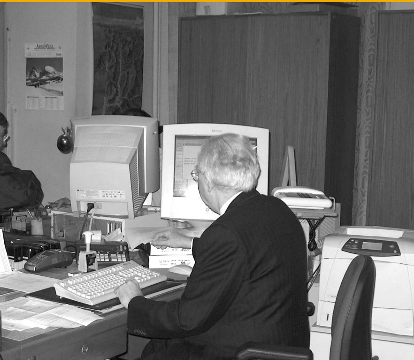
ANDAMENTO TASSO DI OCCUPAZIONE