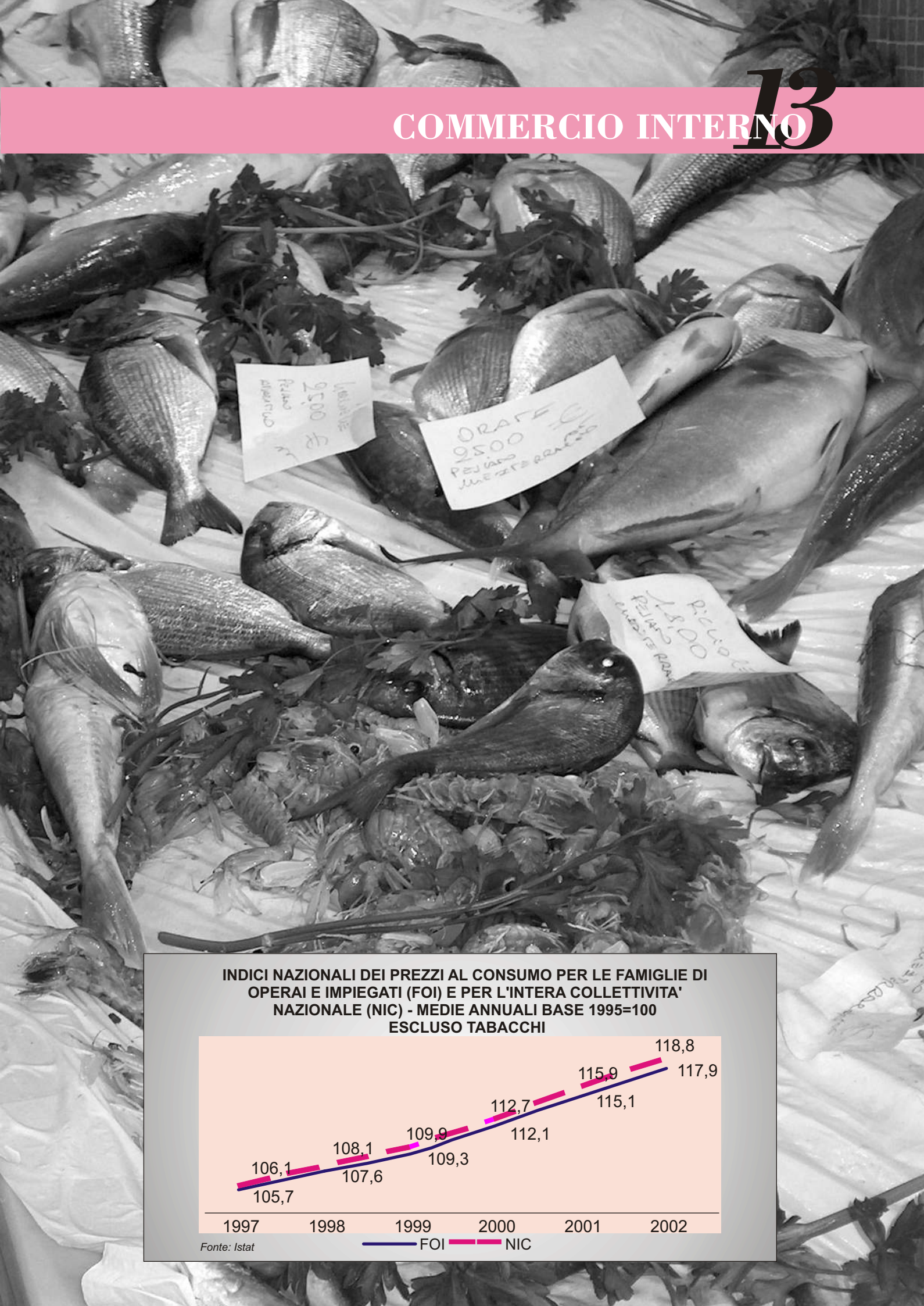
INDICI NAZIONALI DEI PREZZI AL CONSUMO PER LE FAMIGLIE DI OPERAI E IMPIEGATI (FOI) E PER L'INTERA COLLETTIVITA' NAZIONALE (NIC) - MEDIE ANNUALI BASE 1995=100 ESCLUSO TABACCHI