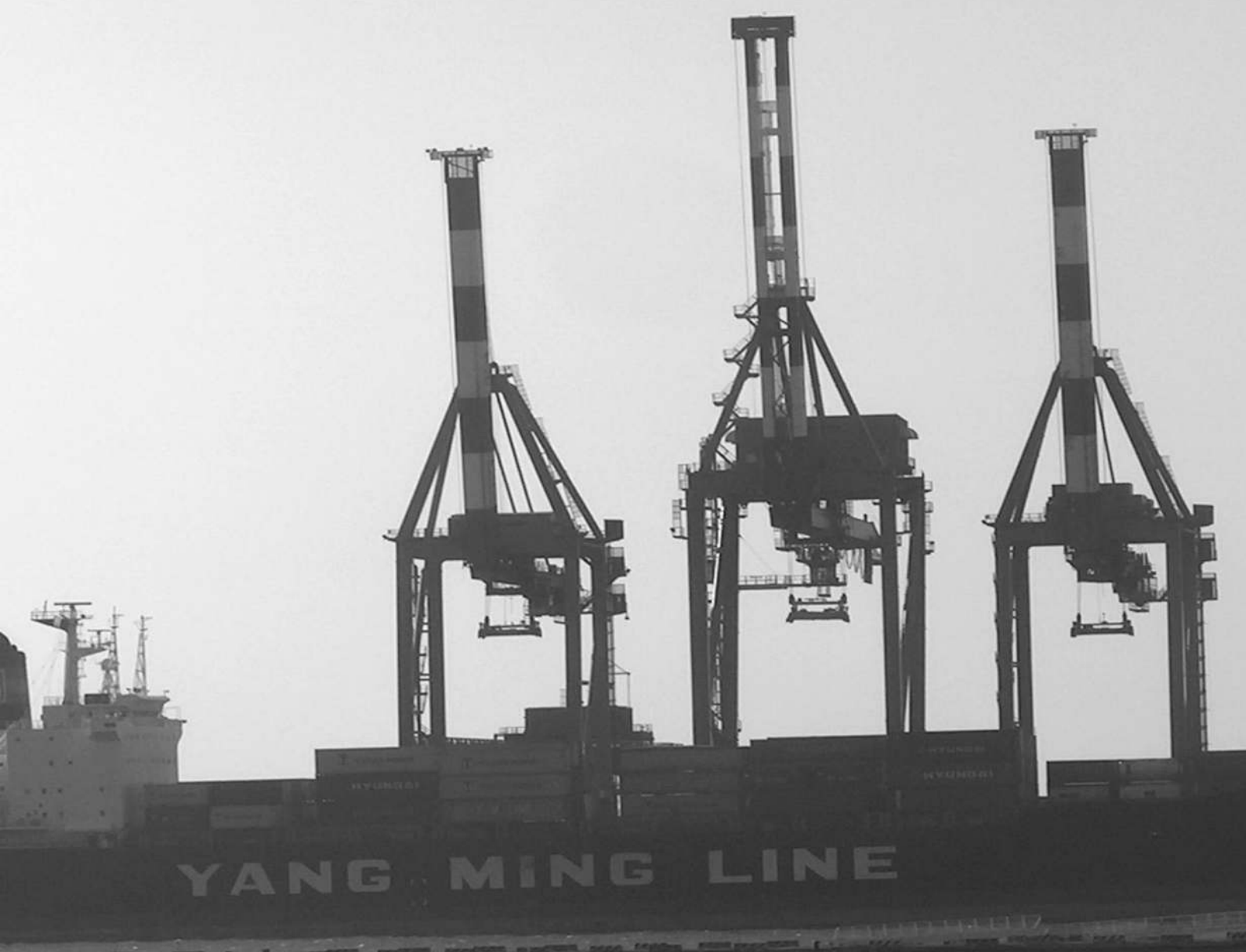
ESPORTAZIONI 2002 PER AREA GEOGRAFICA