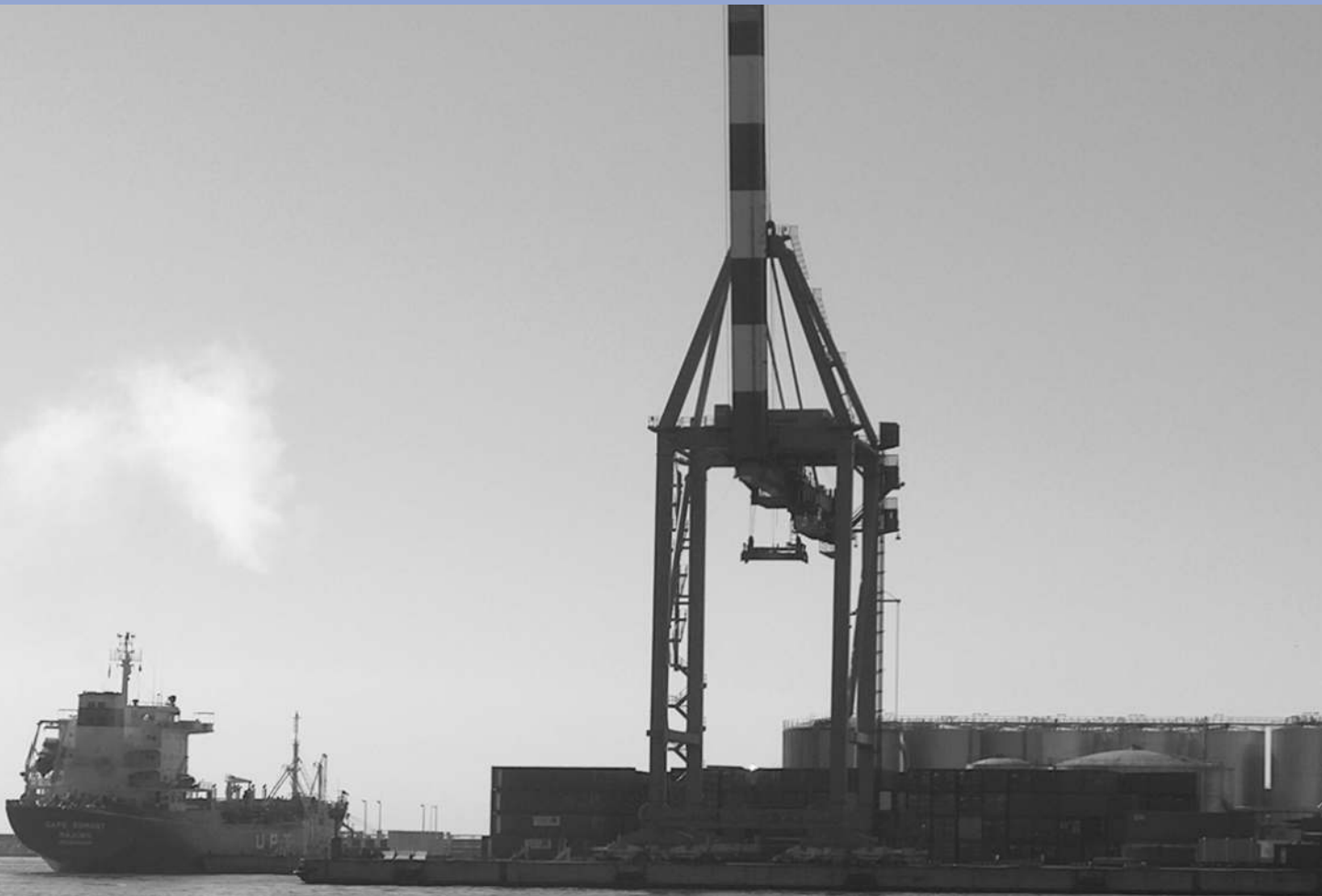
ANDAMENTO TRAFFICO MERCI DEL SISTEMA PORTUALE LIGURE - ANNI 1998-2002