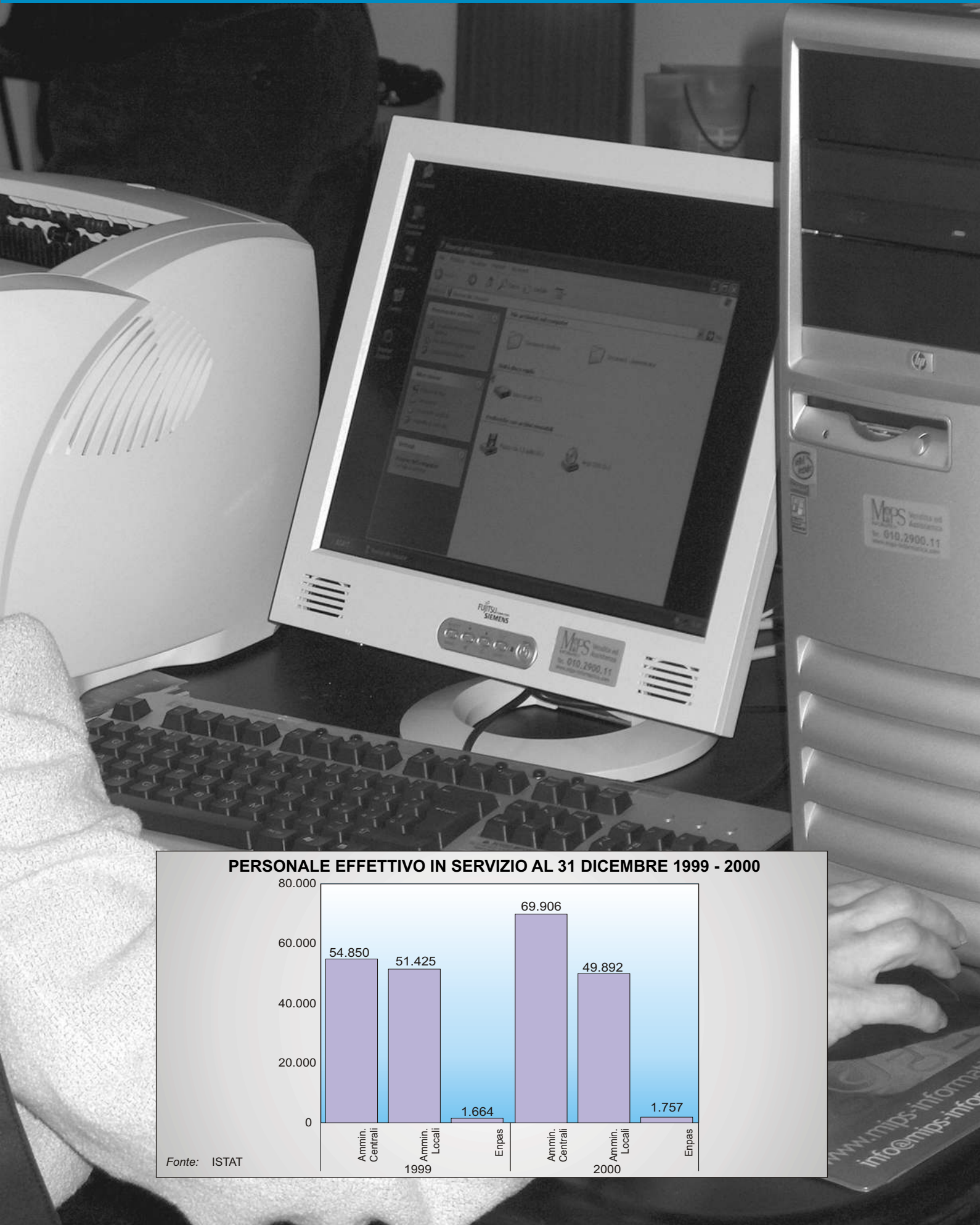
PERSONALE EFFETTIVO IN SERVIZIO AL 31 DICEMBRE 1999 - 2000